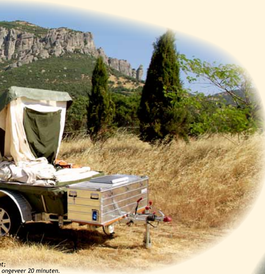
...; ongeveer 20 minuten.