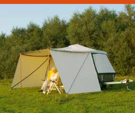
Meer beschutting dankzij de zijwandenset voor de standaard luifel