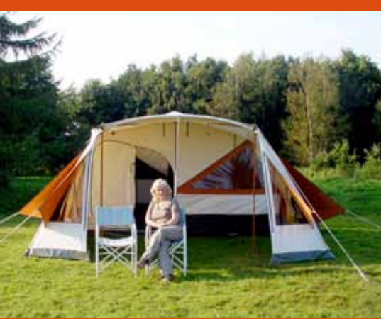
De voortent kan je in vele verschillende standen opzetten