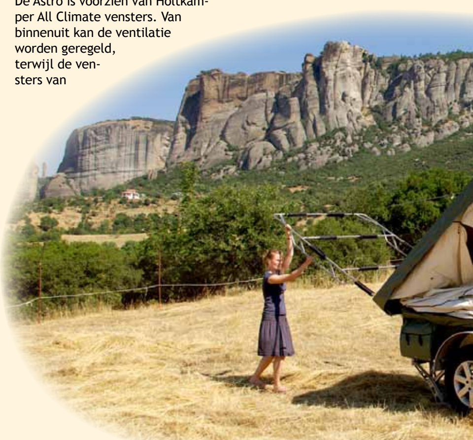
Het opzetten van de Astro met luifel kost je dankzij het geautomatiseerde luifelframe nog géén minuut over het opzetten van de complete voortent met kuipgrondzeil en de voorluifel en keukenluifel doe je

De Astro beschikt standaard over een zeer riant twee-persoons lattenbodembed van ca. 200 x 170 cm met een polyether- of koudschuimmatras. Goed slapen tijdens de vakantie is zodoende zoveel mogelijk gewaarborgd. Met ritsen kan er een extra kuipgrondzeil van