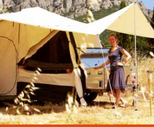
De keukenluifel biedt extra schaduw of beschutting tegen regen