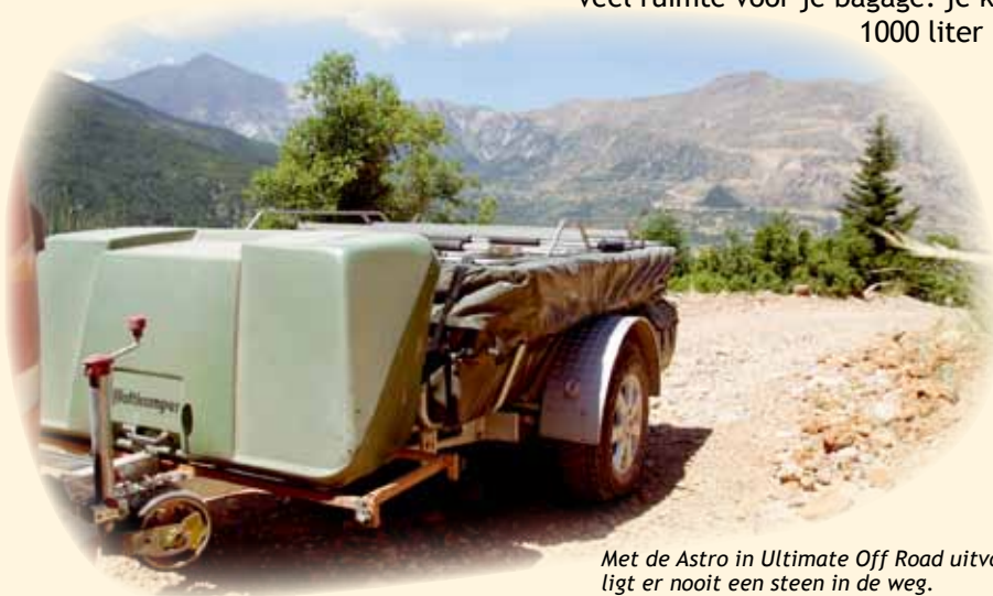
Met de Astro in Ultimate Off Road uitvoering ligt er nooit een steen in de weg.

De Astro is extreem stormvast dankzij het "als-een-jonge-boom-meegeevende" tentframe. Op IJsland doorstond de Astro met gemak een storm van windkracht 10.