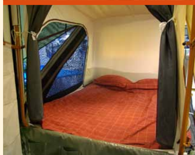
Volop ventilatie rondom!