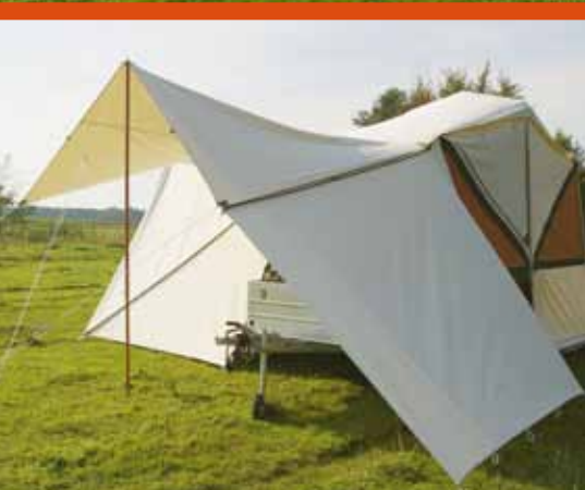
Plaats een achterwand aan de keukenluifel voor nog meer beschutting of privacy

Ook tegen zware regenval is de Astro bestand. Het ontstaan van "waterzakken" op het tentdak is bij een Holtkamper gemakkelijk te voorkomen. Door de unieke constructie geldt: des te meer water er valt, des te effectiever de waterafloop.