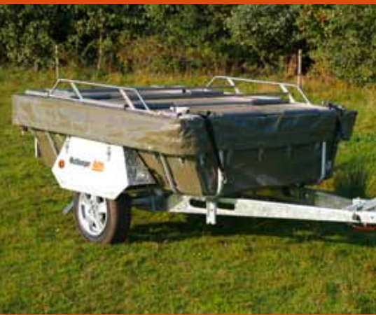
Holtkamper Astro Hardtop in Ultra Light Aluminium uitvoering