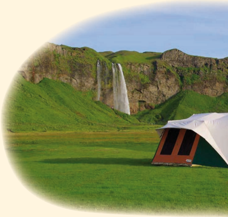
Holtkamper Kyte S met de unieke Géénstoksluifel.

De Kyte is voorzien van het wereldwijd gepatenteerde systeem voor ventilatie, isolatie en anti-condensvorming: het Holtkamper Membrane Airco Tentsystem. Een systeem waar je na 1 x gebruik, nooit meer zonder wilt. Bij hitte (boven de 30 graden) zet je het dak open en stroomt de warme lucht de tent uit. Tegelijkertijd krijgt de zon niet de kans de lucht in de tent opnieuw te verwarmen; de lucht onder het buitenste dak kan immers direct ontsnappen zodra de zon de temperatuur doet stijgen. Bij alle andere (normale) weersomstandigheden