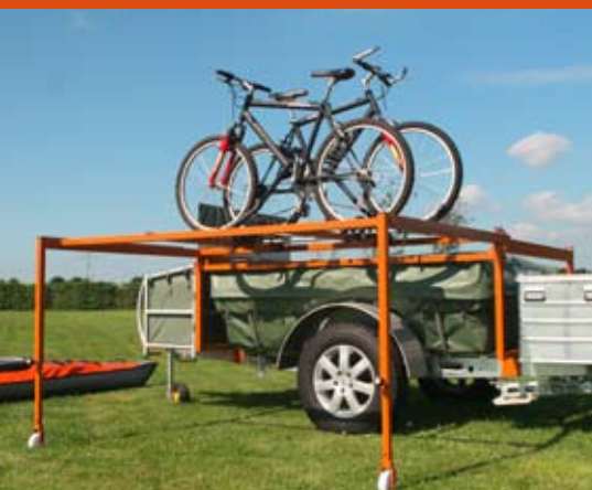
Fietsen mee? Er zijn vele mogelijkheden! Afgebeeld: de Bike-N-Boat-Roller (Kyte S)