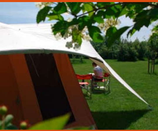
De Roof Extensions overdekken ten aller tijde de vensters tegen zon en regen!