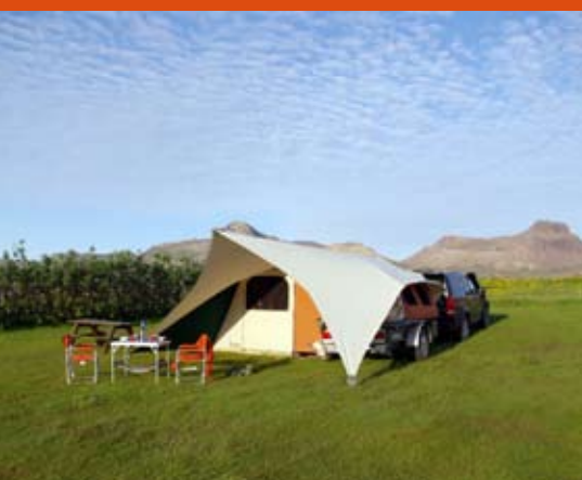
De keuken is automatisch beschermt tegen regen en zon

zelfdragende overkappingen beschermen de vensters en de zijwand van de hoofdtent tegen regen en directe zoninstraling. Ook worden de zijwanden minder snel vies dankzij de Roof Extensions. Vuil is, gecombineerd met vocht, de grootste veroorzaker van schimmelvorming in tentdoek. Dit gevaar wordt door de Roof Extensions beperkt. Voor het uitvouwen van de Roof Extensions heb je geen losse stokken nodig; het scharnierbare frame wordt gewoon mee in- en uitgevouwen.