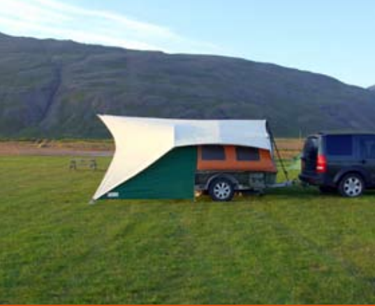
Laat de auto rustig aangekoppeld bij een enkele overnachting.