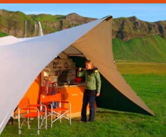
Het eten wordt nog lekkerder in de prachtige Kyte keuken.