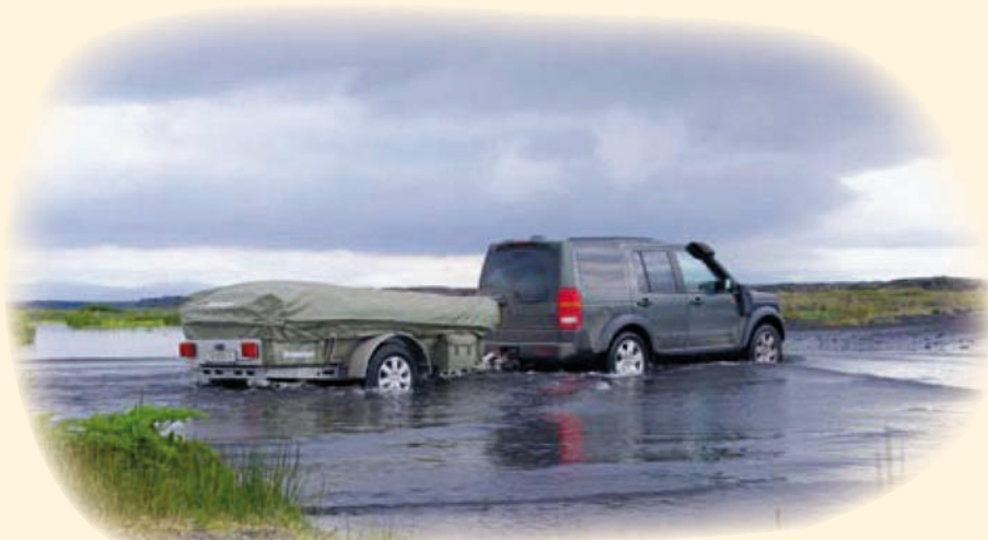
De Kyte in Off Road uitvoering trek je probleemloos door een rivier. Kijk voor meer foto's op www.holtkamper.nl/gallery

De Géénstoksluifel loopt vloeiend over in de speciaal voor de Kyte ontworpen Roof Extensions. Deze